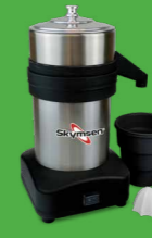
EXB-N EXTRATOR DE SUCOS INOX, CÂMARA DE INOX