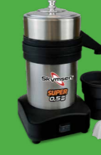
ESB SUPER-N EXTRATOR DE SUCOS INOX, CÂMARA DE INOX