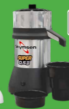
EX SUPER EXTRATOR DE SUCOS INOX