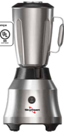
LI1.5 LIQUIDIFICADOR INOX, COPO INOX, ALTA ROTAÇÃO, 1,5 LITROS