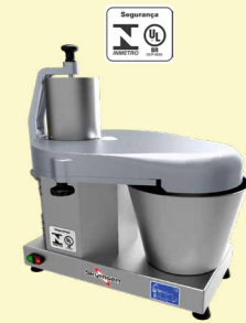
PA-14-N PROCESSADOR DE ALIMENTOS, COM 6 DISCOS DIÂMETRO 429 mm