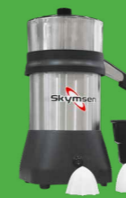
EX EXTRATOR DE SUCOS INOX