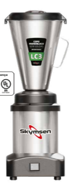
LC2 / LC3 / LC4 LIQUIDIFICADOR COMERCIAL INOX, COPO MONOBLOCO INOX