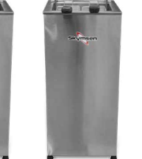
FAP | FAP8 FRITADEIRA ELÉTRICA ÁGUA E ÓLEO 15 LITROS, INOX, DE MESA