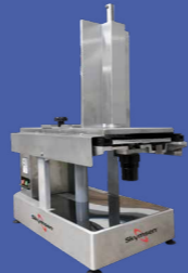
FFA CORTADOR DE FRIOS AUTOMÁTICO, INOX, LÂMINA 260 mm