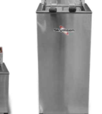
F2P | F2P8 FRITADEIRA ELÉTRICA ZONA FRIA 15 LITROS, INOX DE PISO