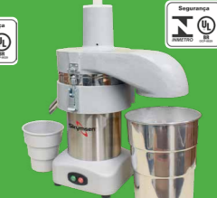
CSE CENTRÍFUGA DE SUCOS