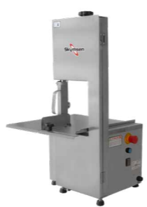
SBL SERRA FITA DE BANCADA PARA CARNE INOX COM REGULAGEM DE CORTE, LÂMINA 1.740 mm