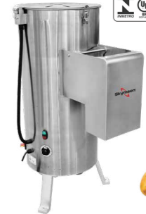
DB-25HD-N DESCASCADOR INOX, 25 KG, HEAVY DUTY