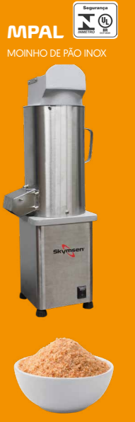
MPAL MOINHO DE PÃO INOX