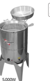
FC FRITADEIRA ELÉTRICA ÁGUA E ÓLEO, 24 LITROS, INOX