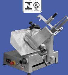
FA-300 DUAL CORTADOR DE FRIOS AUTOMÁTICO E SEMIAUTOMÁTICO INOX, LÂMINA 300 MM