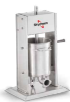
EL10V ENSACADEIRA DE LINGUIÇA VERTICAL INOX, 10 LITROS