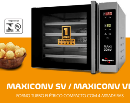
MAXICONV SV / MAXICONV VP FORNO TURBO ELÉTRICO COMPACTO COM 4 ASSADEIRAS