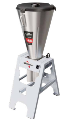
LB15 / LB25 LIQUIDIFICADOR COMERCIAL, BASCULANTE, COPO MONOBLOCO INOX