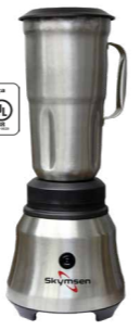
TA2 LIQUIDIFICADOR INOX, COPO INOX, ALTA ROTAÇÃO, 2,0 LITROS