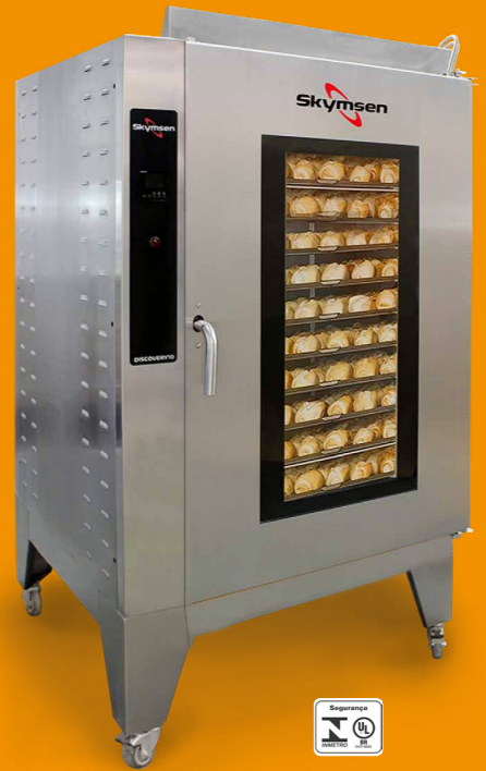
DISCOVERY 10 FORNO TURBO ELÉTRICO PARA 10 ASSADEIRAS.