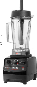
BM2 LIQUIDIFICADOR MAXI BLENDER, COPO TRITAN, ALTA ROTAÇÃO, COM VARIADOR DE VELOCIDADE, 2,0 LITROS