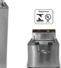
FAM FRITADEIRA ELÉTRICA ÁGUA E ÓLEO 15 LITROS, INOX, DE MESA