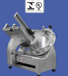
CA-350L CORTADOR DE FRIOS AUTOMÁTICO INOX, LÂMINA 350 MM, HEAVY DUTY