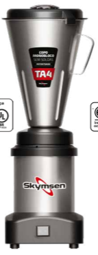
TA4 LIQUIDIFICADOR INOX, ALTA ROTAÇÃO, COPO MONOBLOCO INOX