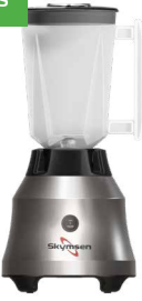
LT1.5 LIQUIDIFICADOR INOX, COPO PLÁSTICO, ALTA ROTAÇÃO, 1,5 LITROS