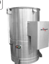
DB-10 DESCASCADOR INOX, 10 kg