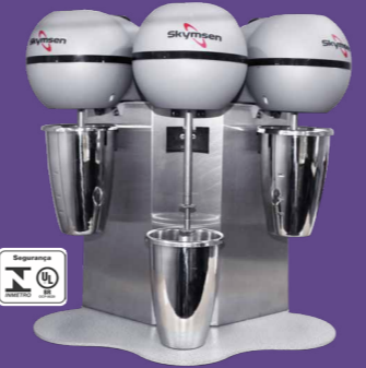
BMS-3-N BATEDOR MILKSHAKE, COPO INOX, 3 HASTES