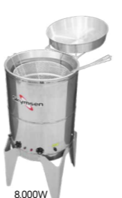
FC8 FRITADEIRA ELÉTRICA ÁGUA E ÓLEO, 24 LITROS, INOX