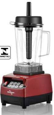
BS2 LIQUIDIFICADOR SUPREME BLENDER, COPO TRITAN, ALTA ROTAÇÃO, COM FUNÇÕES PRÉ-PROGRAMADAS, 2,0 LITROS