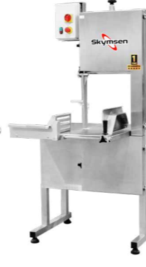
SFL-282HD SFL-315HD SERRA-FITA PARA OSSOS INOX, COM EMPURRADOR, MESA MÓVEL, REGULADOR DE CORTE