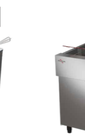
FRP-24 FRITADEIRA ELÉTRICA ÁGUA E ÓLEO, INOX, DE PISO