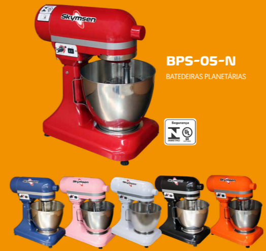
BPS-05-N BATEDEIRAS PLANETÁRIAS