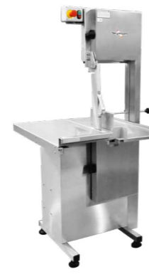
SL-282 SERRA-FITA PARA OSSOS INOX, COM EMPURRADOR, MESA MÓVEL, REGULADOR DE CORTE, LÂMINA 2.820 mm | 3.150 mm, HEAVY DUTY