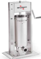
EL15V ENSACADEIRA DE LINGUIÇA VERTICAL INOX, 15 LITROS