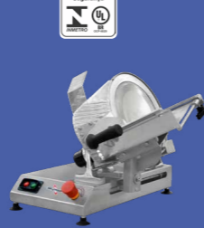
CFI-300L-N CORTADOR DE FRIOS INOX, LÂMINA 300 mm