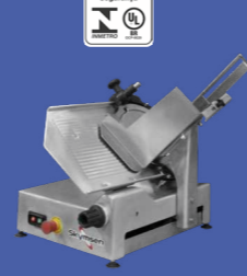
FA-300 CORTADOR DE FRIOS AUTOMÁTICO INOX, LÂMINA 300 MM