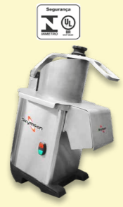
PA7 PRO PROCESSADOR DE ALIMENTOS, INOX, COM 7 DISCOS DIÂMETRO 203 mm