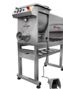
HS-98 MOEDOR HOMOGENEIZADOR DE CARNE INOX, BOCA 98 INOX