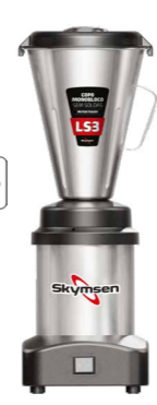
LS2 / LS3 / LS4 LIQUIDIFICADOR COMERCIAL INOX, COPO MONOBLOCO INOX