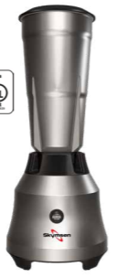
LI2 LIQUIDIFICADOR INOX, COPO INOX, ALTA ROTAÇÃO, 2,0 LITROS