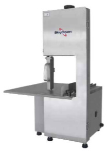
SB SERRA FITA DE BANCADA PARA CARNE COM REGULAGEM DE CORTE, LÂMINA 1.740 mm