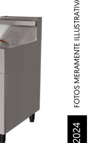
FG20 GLP / GN/CD FRITADEIRA ELÉTRICA ÁGUA E ÓLEO, 38 LITROS, INOX, TRIFÁSICA