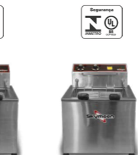
F2M | F2M8 FRITADEIRA ELÉTRICA ZONA FRIA 15 LITROS, INOX DE MESA