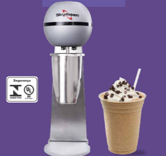
BMS-N BATEDOR MILKSHAKE, COPO INOX, 1 HASTE