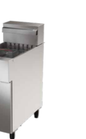
FE25 FRITADEIRA ELÉTRICA ÁGUA E ÓLEO, 25 LITROS, INOX, TRIFÁSICA