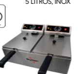
FED-20-N FRITADEIRA ELÉTRICA, 2 CUBAS 5 LITROS, INOX