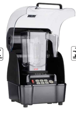
BARI.5 LIQUIDIFICADOR BLENDER COM ABAFADOR DE RUÍDOS, COPO TRITAN, ALTA ROTAÇÃO, COM FUNÇÕES PRÉ-PROGRAMADAS, 1,5 LITROS