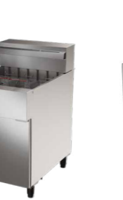
FE38 FRITADEIRA ELÉTRICA ÁGUA E ÓLEO, 38 LITROS, INOX