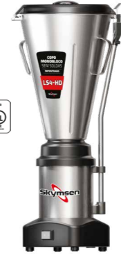
LS4-HD LIQUIDIFICADOR COMERCIAL INOX, COPO MONOBLOCO INOX, HEAVY DUTY