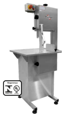
SL-218 SERRA FITA PARA OSSOS, INOX, COM EMPURRADOR, REGULADOR DE CORTE, LÂMINA 2.180 mm